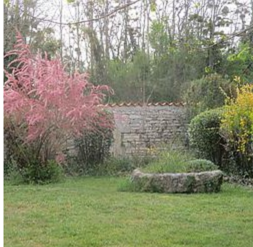
Gîte La Halte du Pinson Brun